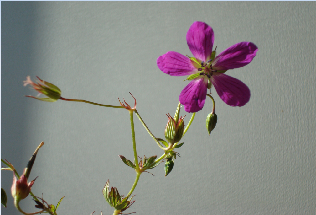
Kärnäva, en av de nya floraväktararterna i länet?

Något om floraväkteriet i Västmanlands län